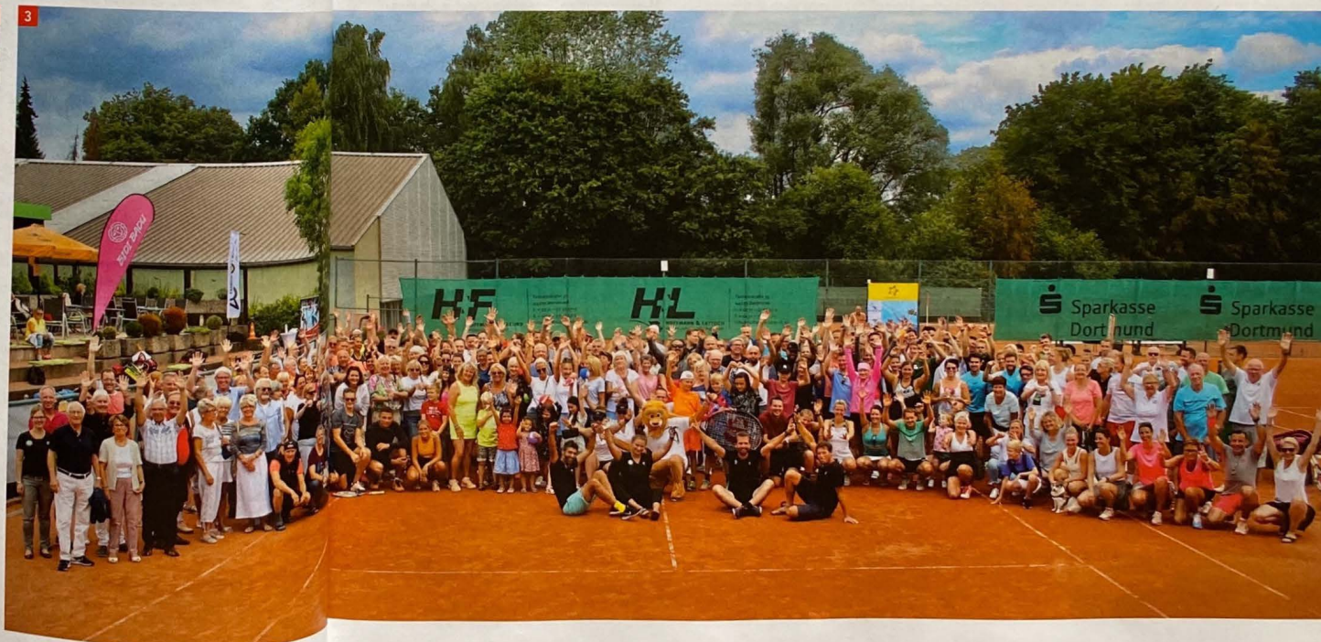
3 Neuer Teilnahme-Rekord mit 266 aktiven Teilnehmern