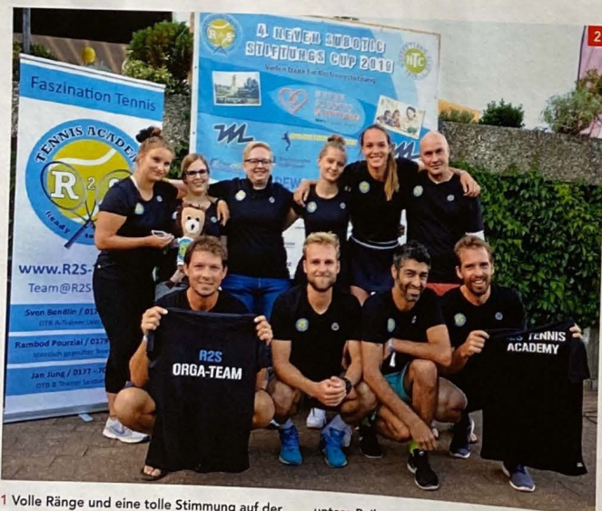
1 Volle Ränge und eine tolle Stimmung auf der Tennisanlage des Hörder TC